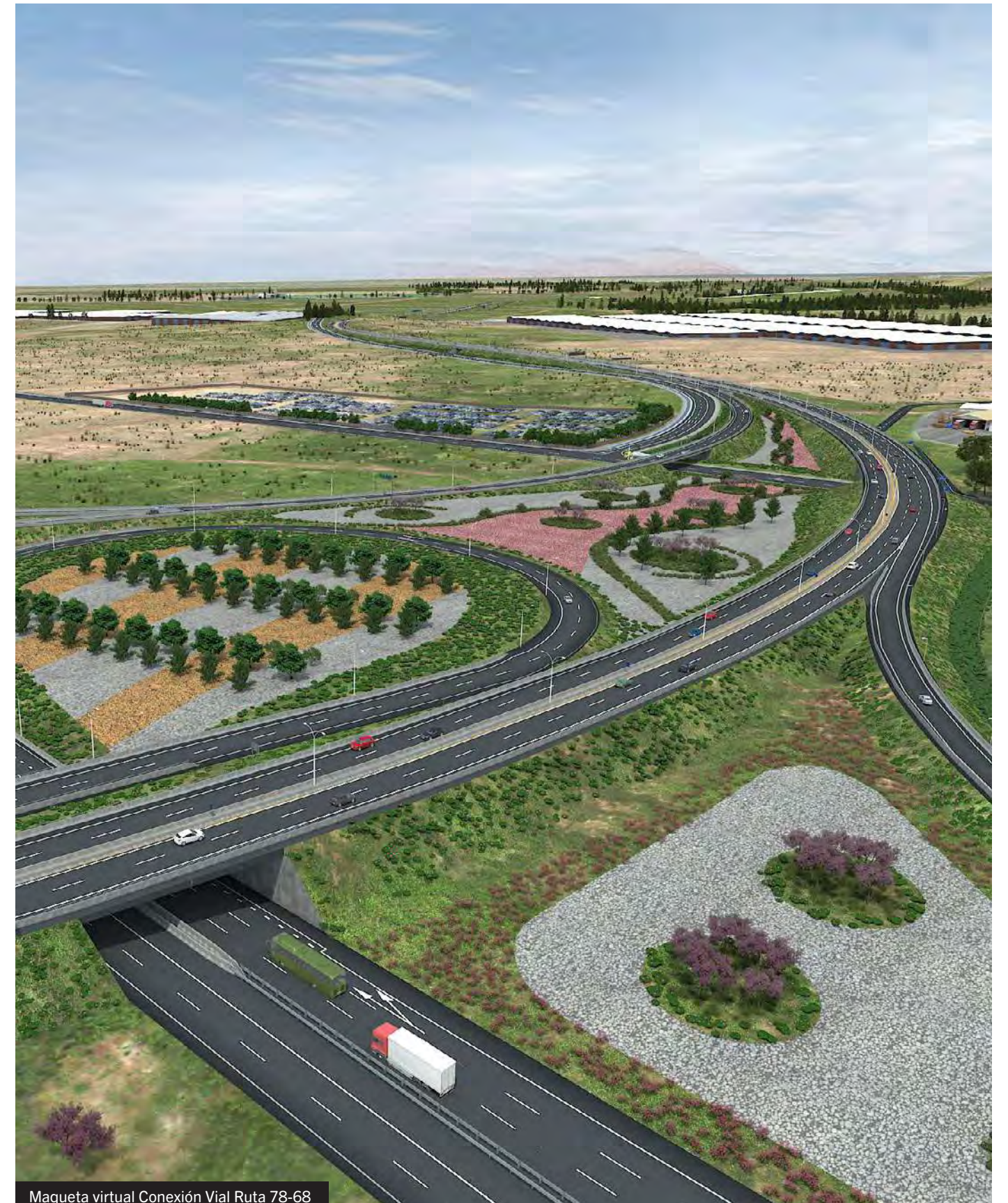
Maqueta virtual Conexión Vial Ruta 78-68

Sociedad Anónima Cerrada, sujeta a las normas aplicables a las sociedades abiertas. Inscrita en la Comisión para el Mercado Financiero, bajo el N° 523 con fecha 12 de diciembre de 2018.